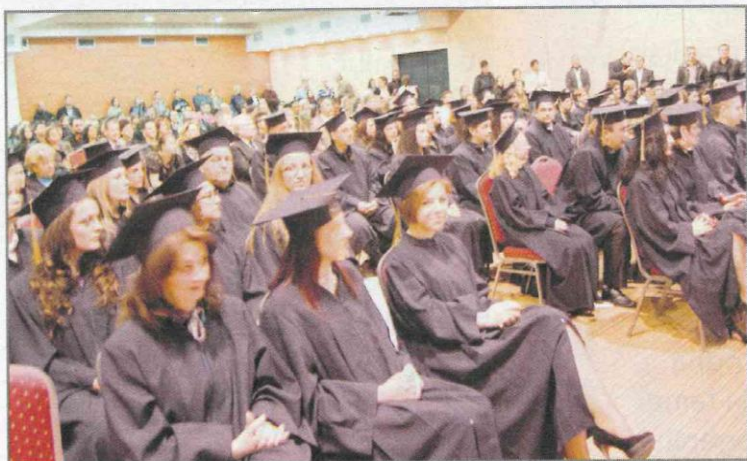
Diplomanti Sveučilišta/Univerziteta „Vitez“ u Travniku

„Sveučilište/Univerzitet Vitez ima 140 profesora i asistenata, po sastavu to je jedna od najjačih ekipa ne samo u BiH, nego i na Balkanu u to uključujemo i