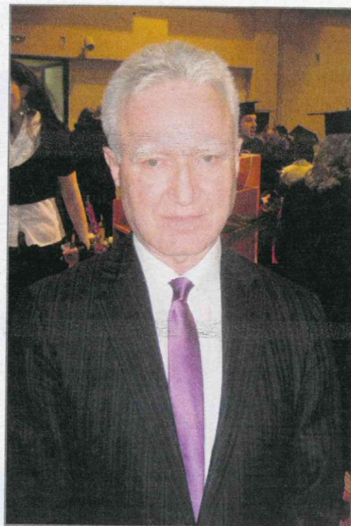
Prof. dr. Vinko Kandžija, dugogodišnji dekan Ekonomskog fakulteta Sveučilišta u Rijeci

se da ćemo imati zajedničke program i na doktorskim studijima. Današnja promocija je samo jedan znak da su ovi ljudi koji su danas završili dobili „vjetar u leđa“, gdje će svaki od njih doprinijeti da ovaj ovdje dio koji je pretrpio i ratna razaranja i druga razaranja može krenuti svojim putem. Vidimo puno ekonomista, puno pravnika, koji će biti sposobni da se uključe u procese koji nas čekaju –reintegracija, integracija, restrukturiranja kako bi bili spremni ući u evropski proces znanja i priključiti Bosnu i Hercegovinu koliko god je to moguće prije Europskoj uniji.